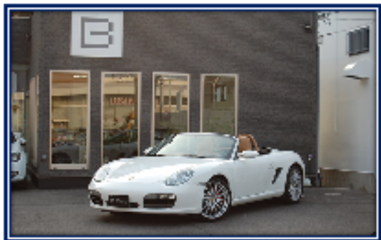
PORSCHE ボクスターS (2人乗)