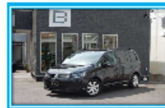
VW ゴルフ トゥーラン (7人乗)