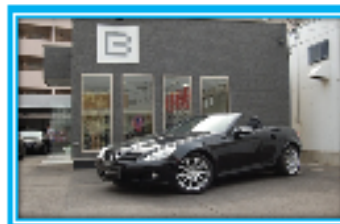
Mercedes-benz SLK280 (2人乗)